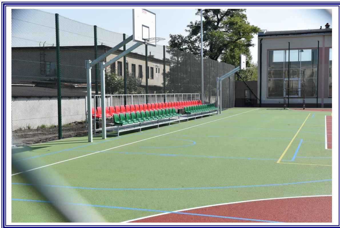
Budowa boiska wielofunkcyjnego przy Zespole Szkół Nr 2 w Aleksandrowie Kujawskim.