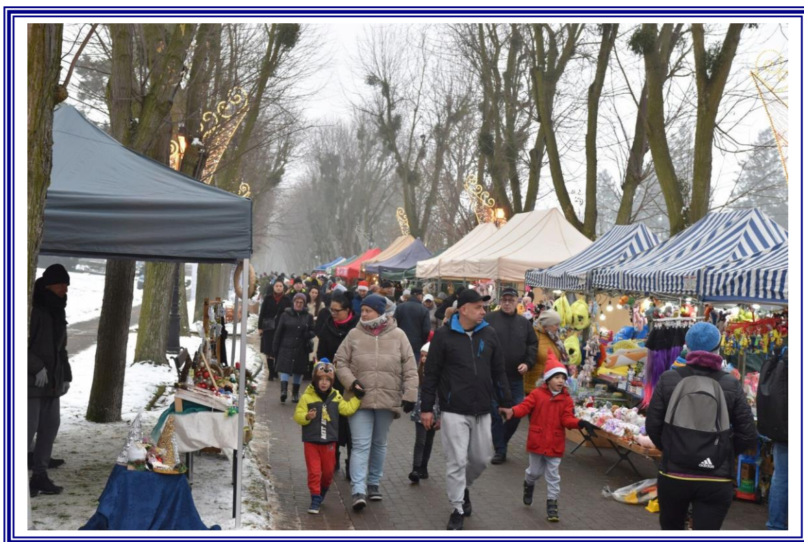
Powiatowy Jarmark Bożonarodzeniowy, organizowany przez Powiat Aleksandrowski i Gminę Miejską Ciechocinek