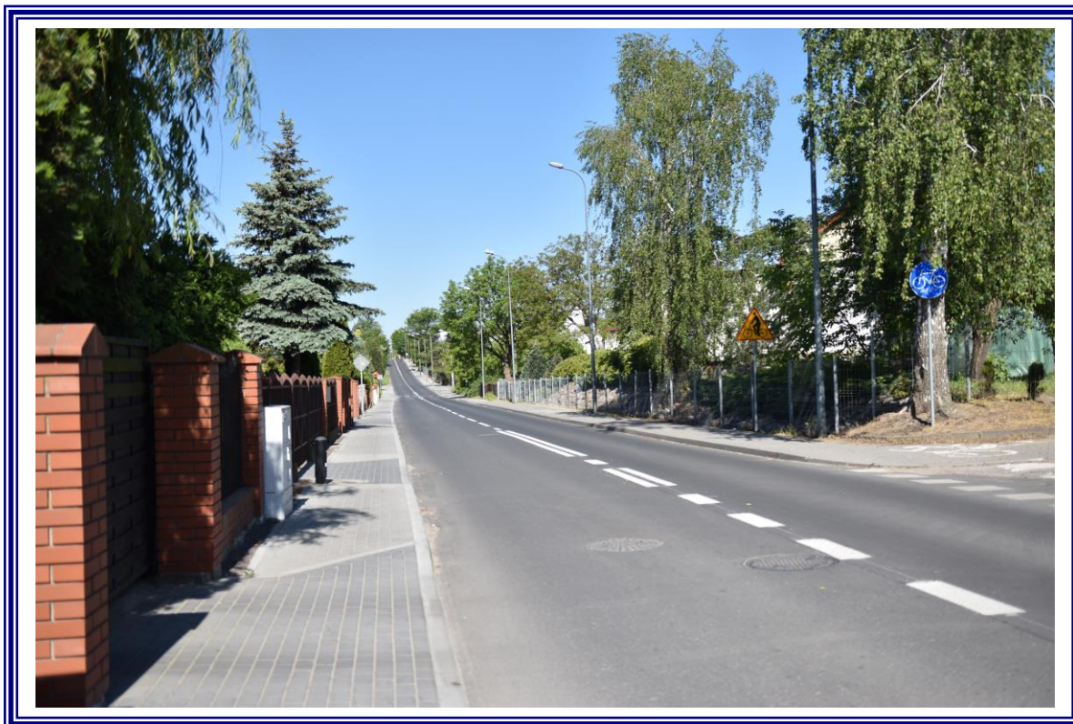
Poprawa infrastruktury drogowej drogi powiatowej nr 2632C ul. Graniczna w Aleksandrowie Kujawskim na odcinku od km 0+000 do km 0+920 na terenie powiatu aleksandrowskiego polegająca na remoncie.