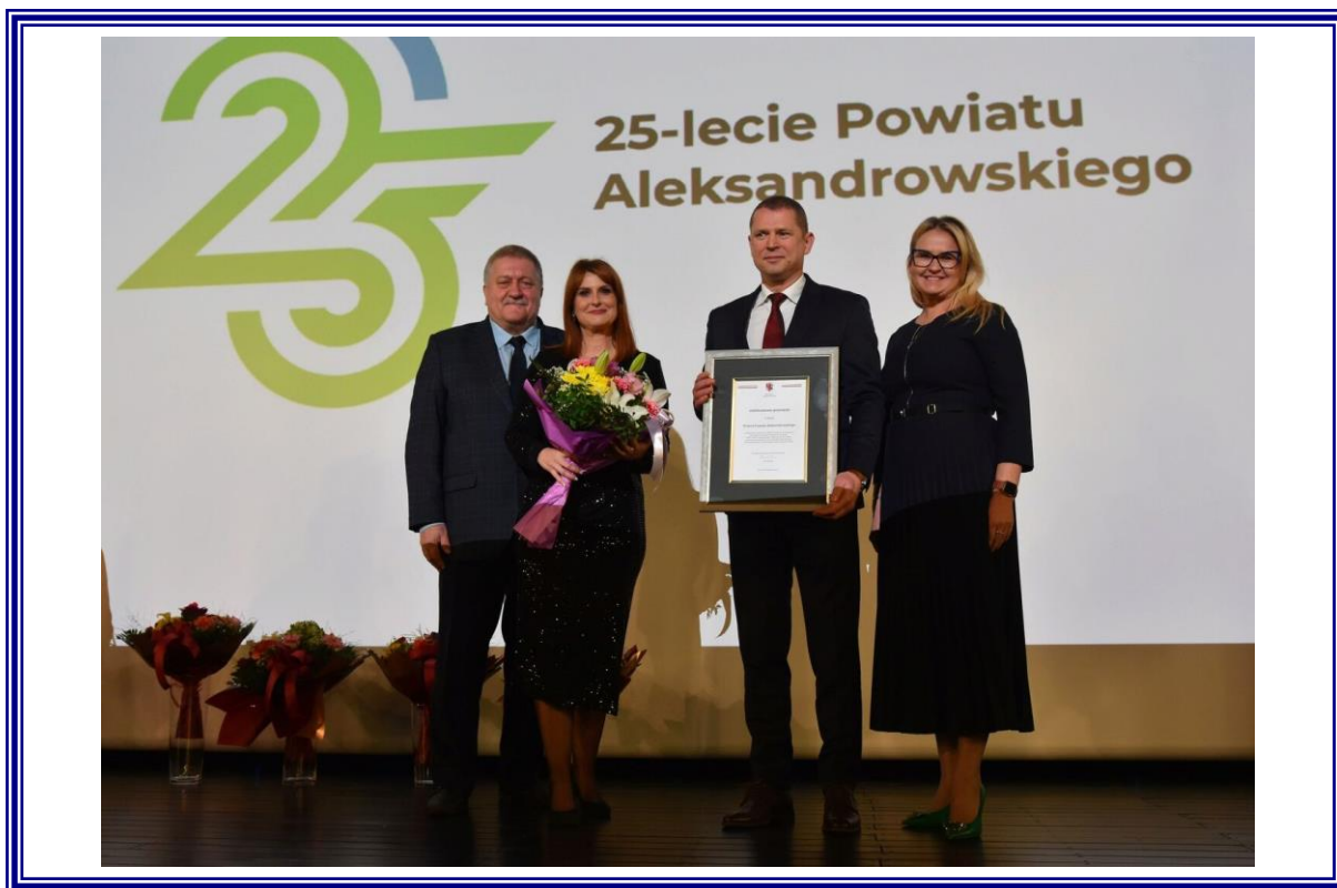
Uroczyste obchody Jubileuszu 25-lecia Samorządu Powiatu Aleksandrowskiego