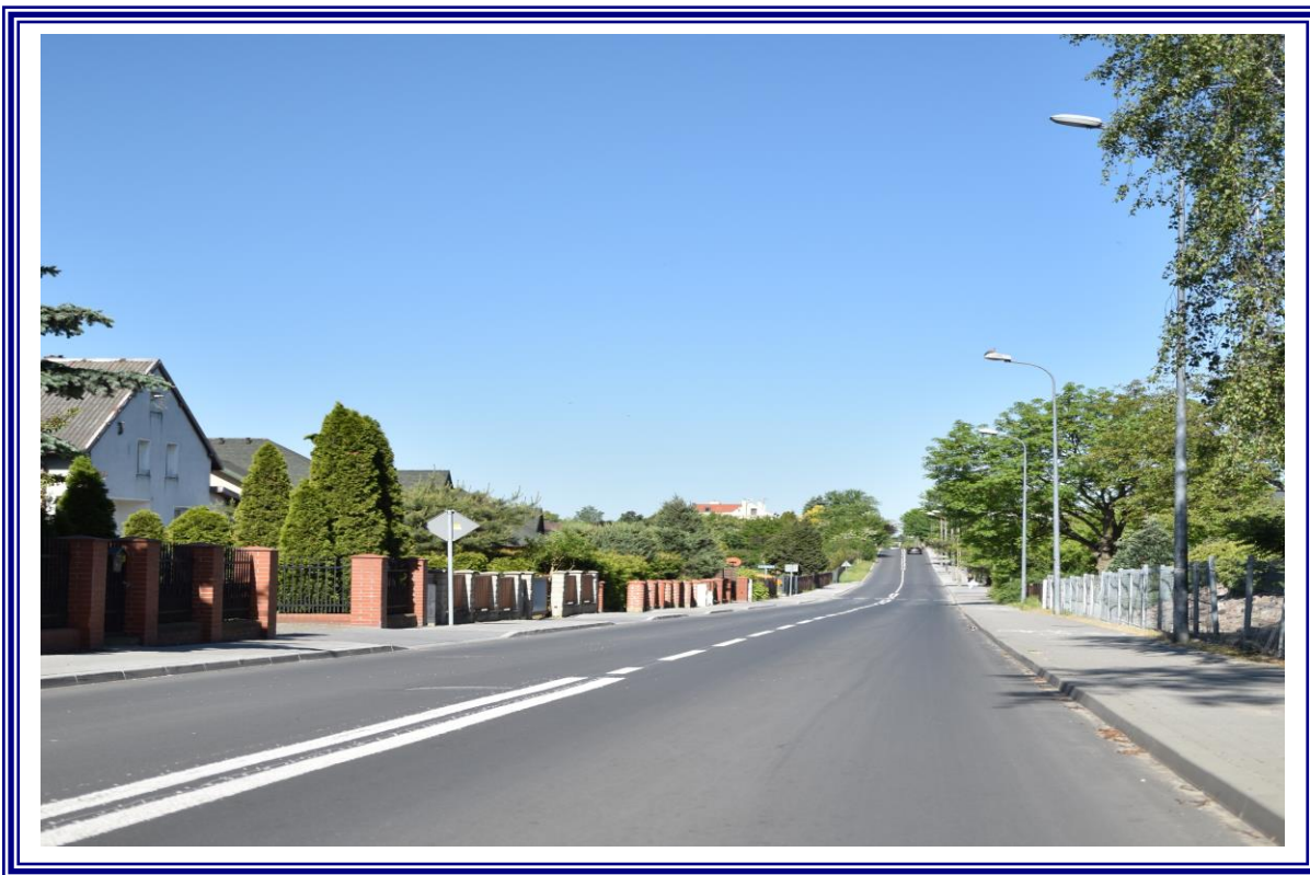
Poprawa infrastruktury drogowej drogi powiatowej nr 2632C ul. Graniczna w Aleksandrowie Kujawskim na odcinku od km 0+000 do km 0+920 na terenie powiatu aleksandrowskiego polegająca na remoncie.