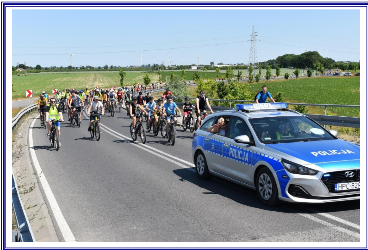
XVI Powiatowy Rajd Rowerowy