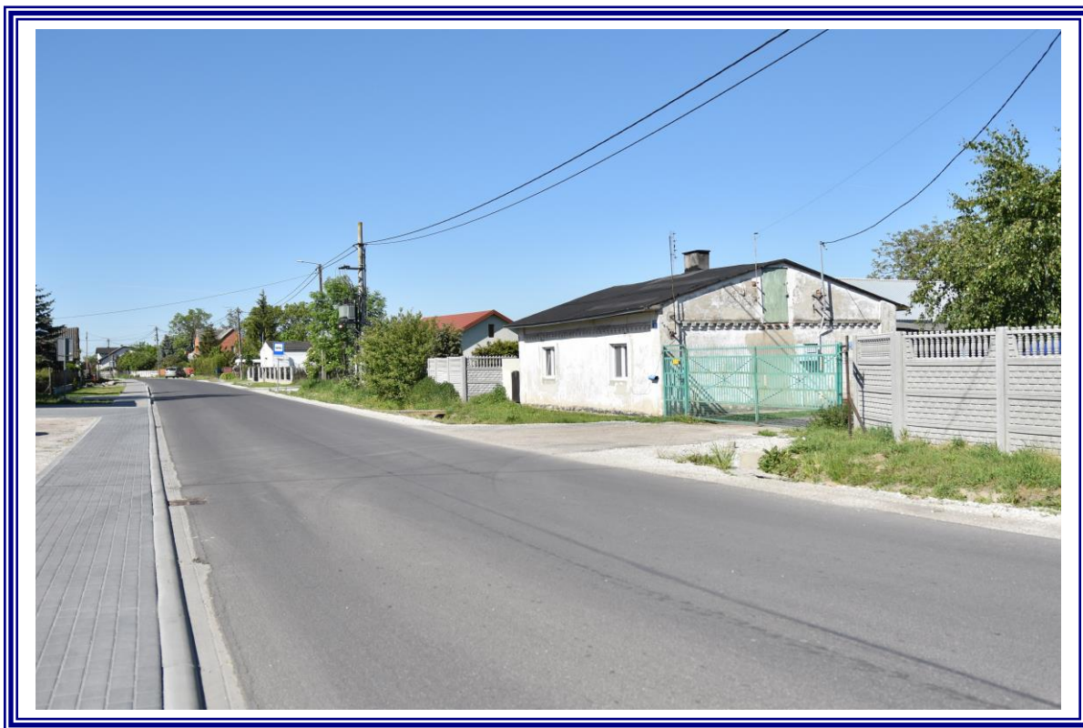
Poprawa infrastruktury drogowej drogi powiatowej nr 2608C Konradowo – Siniarzewo na odcinku od km 0+000 do km 3+100 na terenie powiatu aleksandrowskiego polegająca na remoncie.