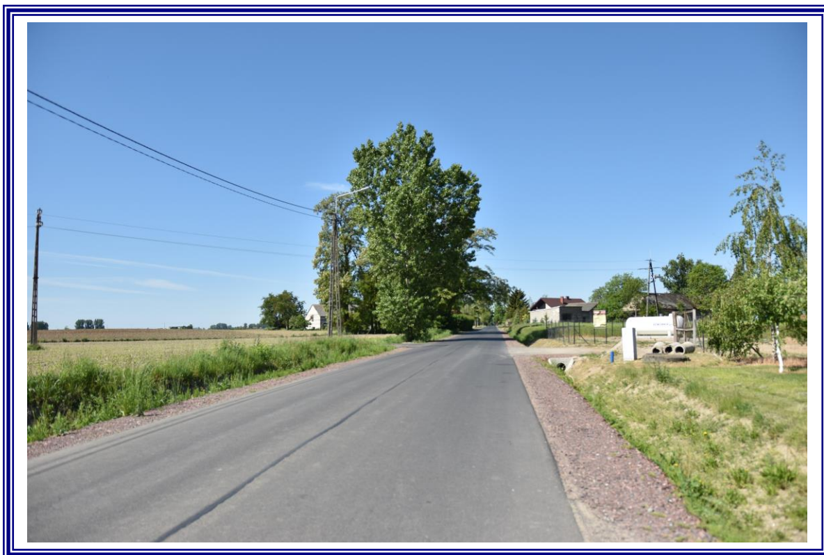
Poprawa infrastruktury drogowej drogi powiatowej nr 2627C Słupy Duże – Bądkowo na terenie powiatu aleksandrowskiego polegająca na remoncie na odcinku od km 2+479,21 do km 4+529,21.