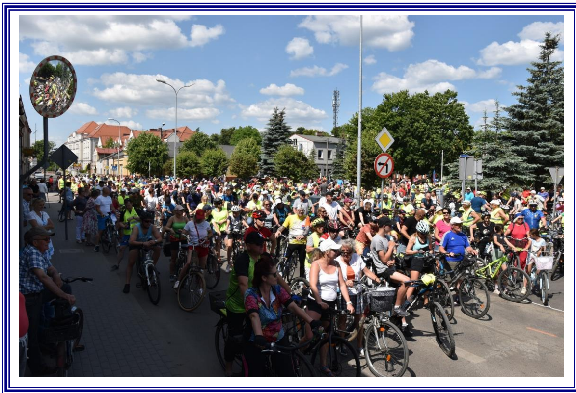
XVI Powiatowy Rajd Rowerowy