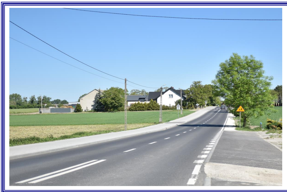
Przebudowa drogi powiatowej nr 2607C Ośno – Zazdromin na odcinku 2,880 km, tj. od km 1+640 do km 4+520 – etap I.