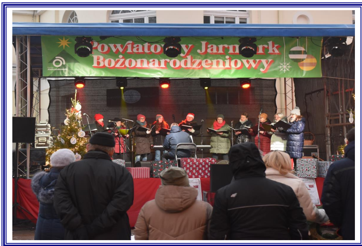
Powiatowy Jarmark Bożonarodzeniowy, organizowany przez Powiat Aleksandrowski i Gminę Miejską Ciechocinek