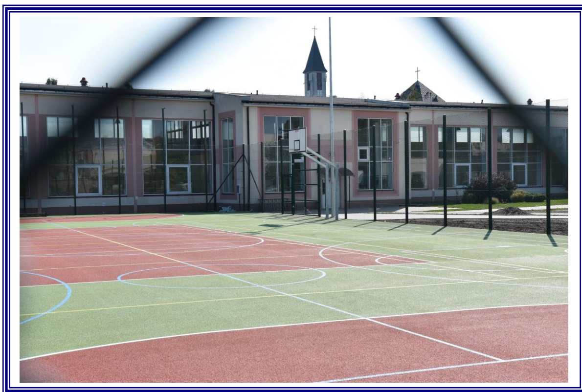
Budowa boiska wielofunkcyjnego przy Zespole Szkół Nr 2 w Aleksandrowie Kujawskim.