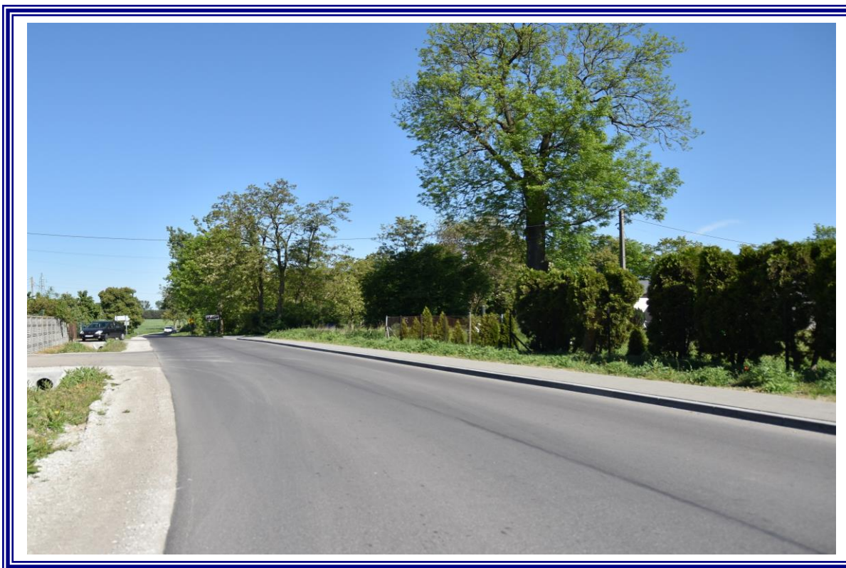
Poprawa infrastruktury drogowej drogi powiatowej nr 2608C Konradowo – Siniarzewo na odcinku od km 0+000 do km 3+100 na terenie powiatu aleksandrowskiego polegająca na remoncie.