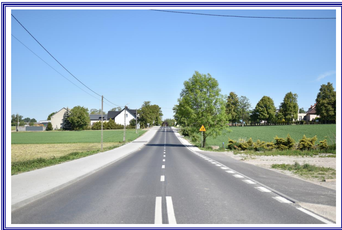
Przebudowa drogi powiatowej nr 2607C Ośno – Zazdromin na odcinku 1,880 km, tj. od km 1+640 do km 4+520 – etap I.