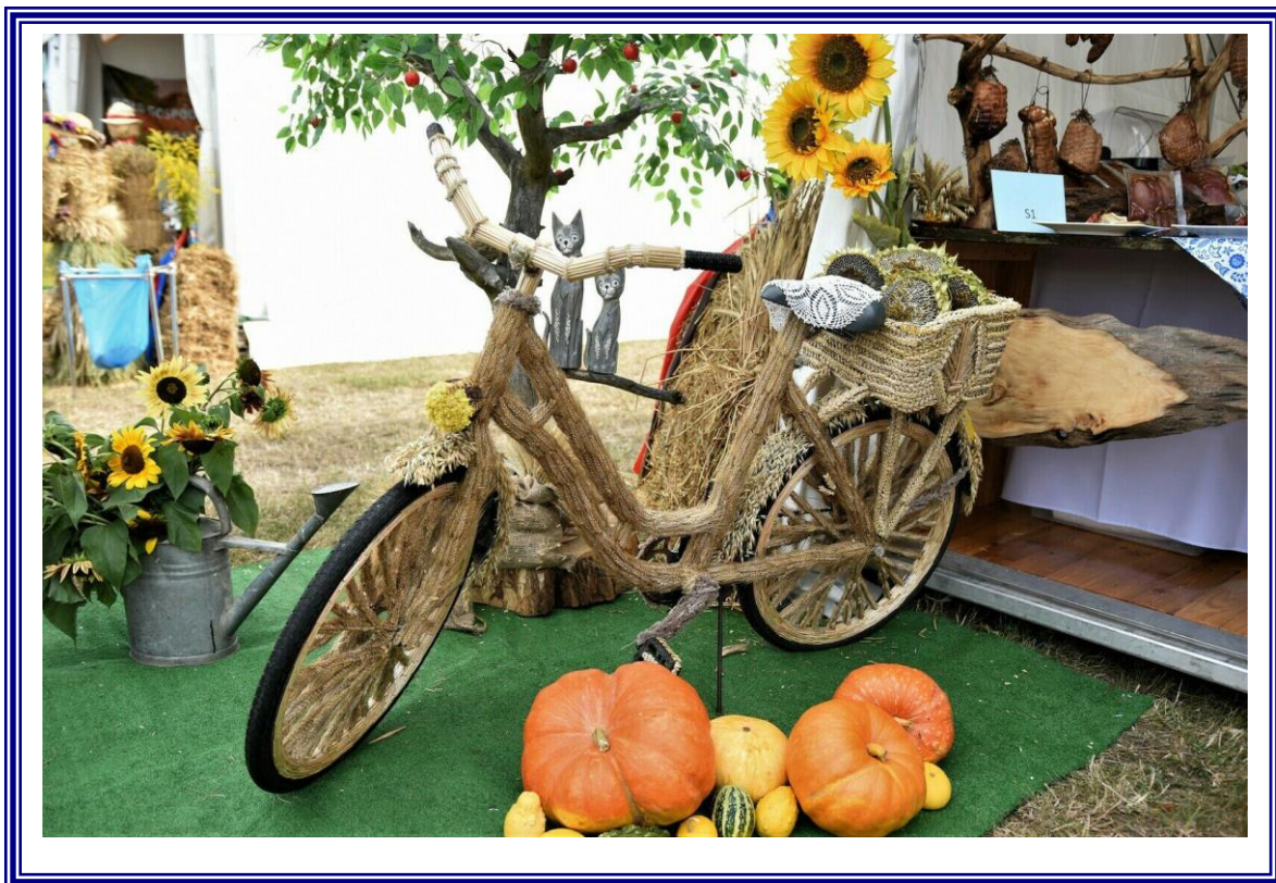
Dożynki Województwa Kujawsko-Pomorskiego i Archidiecezji Gnieźnieńskiej