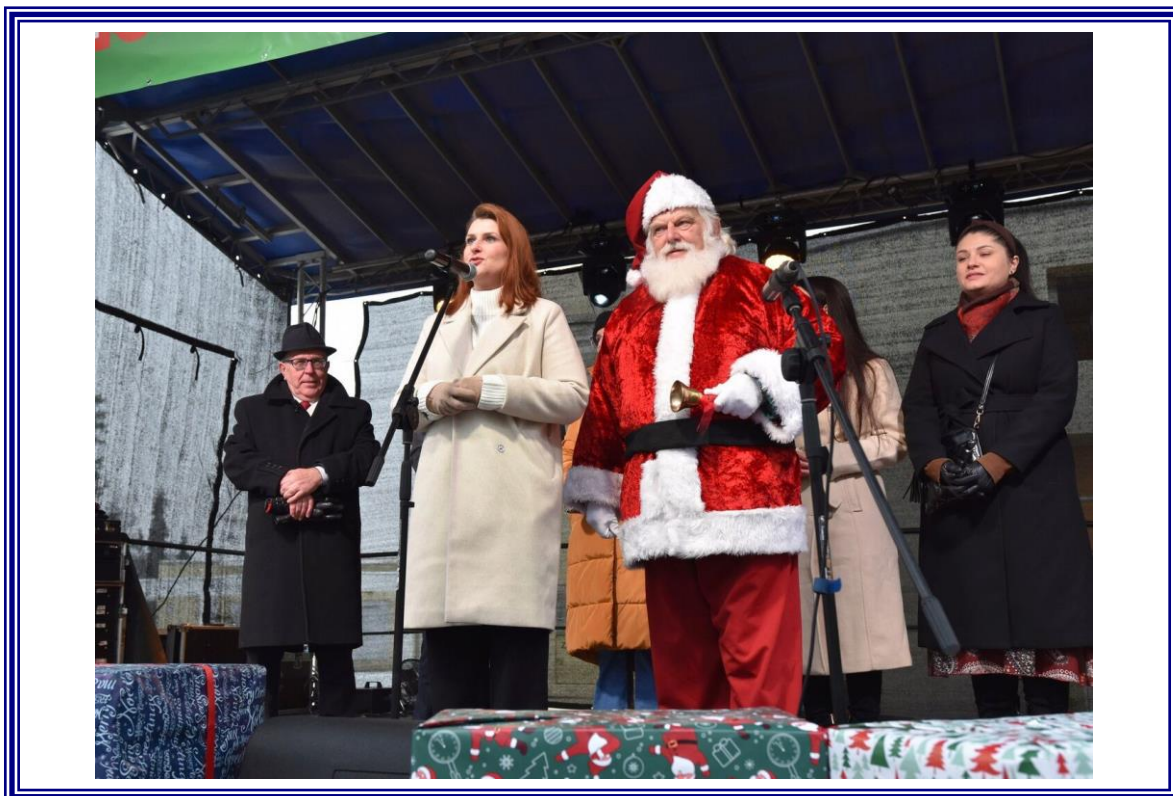
Powiatowy Jarmark Bożonarodzeniowy, organizowany przez Powiat Aleksandrowski i Gminę Miejską Ciechocinek