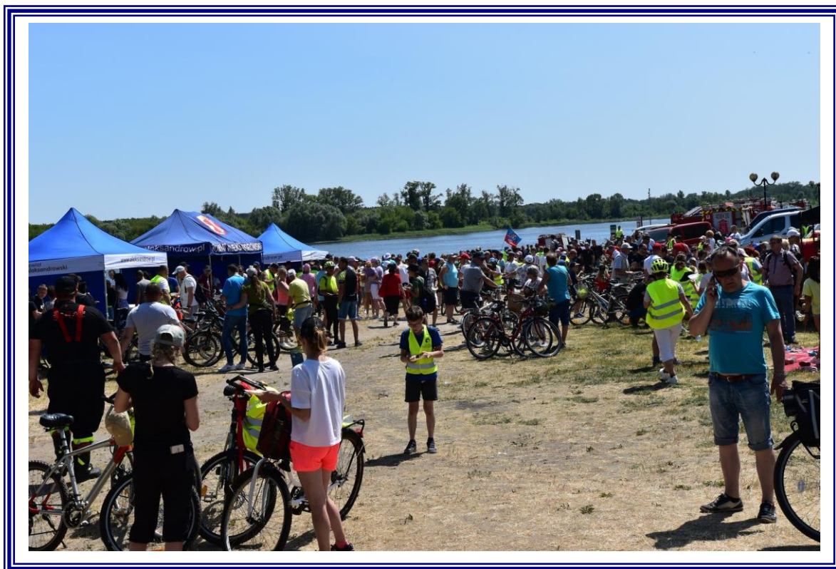
XVI Powiatowy Rajd Rowerowy