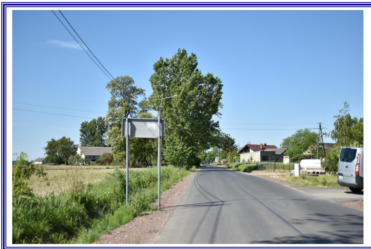
Poprawa infrastruktury drogowej drogi powiatowej nr 2627C Słupy Duże – Bądkowo na terenie powiatu aleksandrowskiego polegająca na remoncie na odcinku od km 2+479,21 do km 4+529,21.