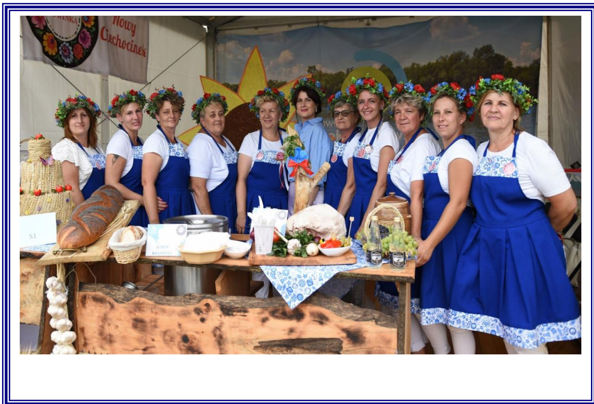
Dożynki Województwa Kujawsko-Pomorskiego i Archidiecezji Gnieźnieńskiej